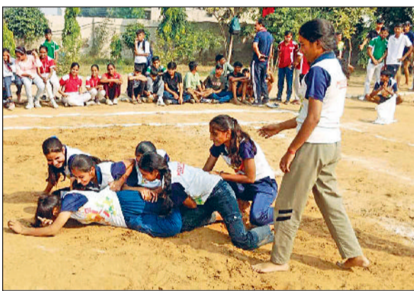
महेन्द्रगढ़। प्रतियोगिता में दमखम दिखाते खिलाड़ी।

अध्यापकों की रस्साकसी व बॉलीबाल के फाइनल मुकाबले खेले गए। मुख्यातिथि ने कहा कि अच्छे भविष्य और बेहतर केरियर के लिए पढ़ाई का जितना महत्व है, उतना ही महत्व बेहतर जीवन के लिए खेलों का भी है। आजकल हमारे भी देश में खेलों का महत्व