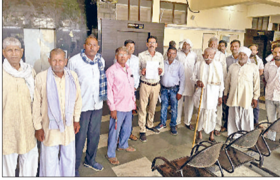
नारनौल। लघु सचिवालय में जनसुनवाई के लिए पहुंचे धरसू के ग्रामीण।