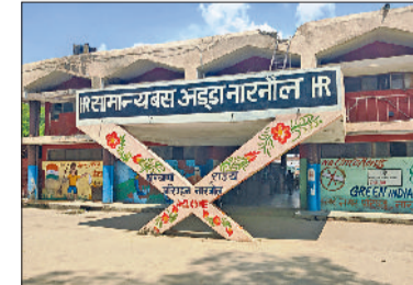
नारनौल। रोडवेज बस स्टैंड।