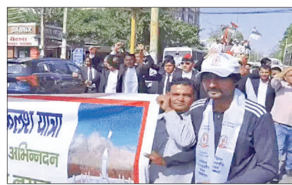
नारनौल। शहर में पहुंची शहादत माटी कलश यात्रा।