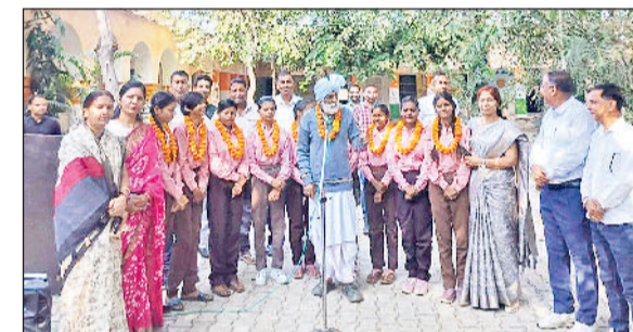
नारनौल। गहली स्कूल की छात्राएं व अन्य।