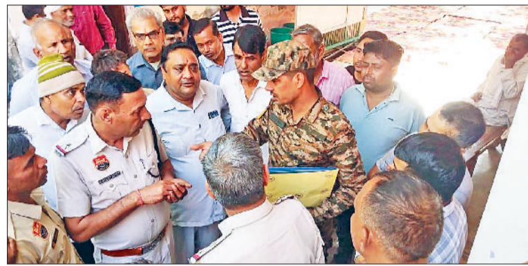
नांगल चौधरी। महापंचायत के प्रतिनिधियों से पूछताछ करती पुलिस व एनसीसी अधिकारी।

जनप्रतिनिधि मौजूद रहे। पंचायत की ओर से नामित पांच व्यक्तियों ने बच्चों को स्वेच्छा से एनसीसी में दाखिलों के लिए आमंत्रित किया। इसके बाद 100 से अधिक बच्चे प्रांगण में पहुंच गए और भर्ती के लिए आवेदन किया। पंजीकृत विद्यार्थियों की लिखित परीक्षा व शारीरिक दक्षता परीक्षा आयोजित की है। 41 सीटों पर 49 आवेदक सलेक्ट हुए हैं। जिनमें मेरिट के आधार पर अंतिम चयन किया जाएगा। ग्रामीणों ने बताया कि दक्षिण हरियाणा के युवाओं में सैनिक बनने का जुनून है, इसलिए एनसीसी को प्राथमिकता देते हैं, लेकिन प्राचार्य की हठधर्मिता के कारण गतिरोध बना हुआ था, जो अब डीईओ की मध्यस्था से सुलझ गया। उन्होंने प्राचार्य के तबादला व कार्यप्रणाली की जांच करने की गुहार लगाई है।