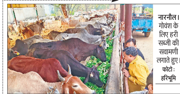
नारनौल। गोवंश के लिए हरी सब्जी की सवामणी लगाते हुए।

बंदी बनाए गए। इनमें 60 जवान हरियाणा के थे। जिनमें रेवाड़ी के 26 व महेन्द्रगढ़ के 16 वीर शामिल थे। यह युद्ध विश्व सैन्य इतिहास की सबसे दुर्लभ लड़ाइयों में से एक माना जाता है। जहां केवल 124 भारतीय जवानों ने तीन हजार 500 चीनी सैनिकों का सामना किया।