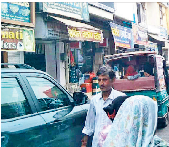
महेन्द्रगढ़। सब्जी मंडी रोड पर लगा जाम।

शहर के सब्जी मंडी सड़क मार्ग पर पार्किंग नहीं होने के कारण जाम लगा रहता है। पार्किंग के अभाव में प्रतिदिन सड़कों के किनारे 800 से अधिक वाहन खड़े रहते हैं। बाजार में सामन लेने आने वाले लोग पार्किंग नहीं होने के कारण अपने वाहन का दुकानों के सामने खड़ा कर देते हैं। जिससे जाम की स्थिति बन रही है। नगर पालिका को शहर में पार्किंग की व्यवस्था करनी चाहिए। ताकि लोगों को परेशानियों का सामना न करना पड़े। दिन प्रतिदिन शहर में वाहनों की संख्या बढ़ती जा रही है, लेकिन नगर पालिका इस ओर ध्यान नहीं दे रही है। पार्किंग की व्यवस्था नहीं होने