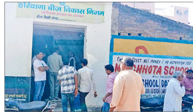
नारनौल। बीज बिक्री केंद्र पर पहुंचे किसान।

किसान हरियाणा विकास बीज निगम कार्यालय पर पहुंच रहे हैं, जहां से उनको सब्सिडी पर बीज बेचा जा रहा है। शहर के रेवाड़ी रोड पर वाई पार्श्व वाली गली में बने कार्यालय पर आजकल किसानों की भीड़ देखने को मिल रही है।