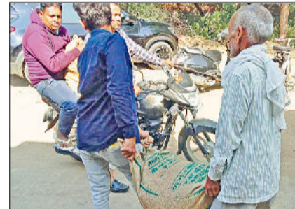
नारनौल। गेहूं खरीद कर ले जा रहे किसान।