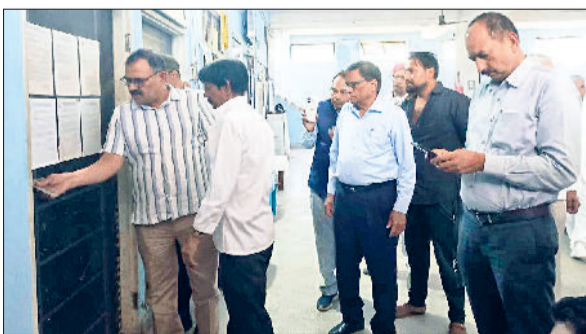
महेंद्रगढ़। अंबेडकर भवन कार्यालय का ताला खुलवाते हुए।

बता दें कि समिति का समस्त रिपोर्ट एवं लेखा-जोखा तीन वर्षों से पूर्व कार्यकारिणी के कब्जे में है। प्रशासन की ओर से कई बार रिपोर्ट सौंपने के निर्देश दिए गए, लेकिन हर बार कोई न कोई बहाना बनाकर प्रक्रिया को टाल दिया गया। समिति के सदस्यों की ओर से इस संबंध में बार-बार लिखित शिकायतें जिला प्रशासन को दी गईं, जिसके बाद जिला उपायुक्त एवं एसडीएम महेंद्रगढ़ की ओर से कार्रवाई करते हुए एक विशेष टीम गठित की गई। जिला उपायुक्त एवं एसडीएम के आदेशानुसार गठित टीम के समक्ष सोमवार को भी डॉ. भीमराव अंबेडकर स्मारक समिति महेंद्रगढ़ की पूर्व कार्यकारिणी के प्रधान